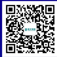
高文律师 GLOBE LAW LAWYERS